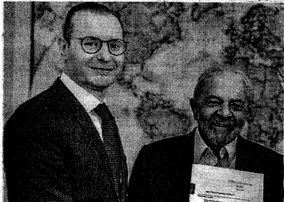
Zanin defendeu Lula nos processos da Operação Lava Jato, que o levaram à prisão e, depois, foram anulados pelo Supremo.

Neste ano, os ministros Ricardo Lewandowski e Rosa Weber completarão 75 anos, idade limite para atuar na corte, e caberá a Lula escolher os dois sucessores. O chefe do Executivo disse,